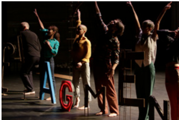
« XYZ ou comment parvenir à ses fins » 2019