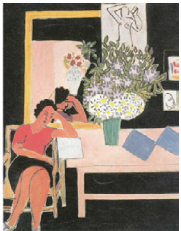
Liseuse sur fond noir - H. Matisse

L' AILE S'USE LA SISE ELUE U. LE LAISSE SI LE SAULE LISA SEULE SALE SEUIL ! ELU SE SALI (T) L'ASILE SUE LA LISEUSE